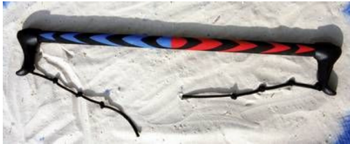
Optie A geen trapeze lus